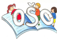
Preglednica 2: Vodji aktivov, krožkov kvalitete in koordinatorji dejavnosti